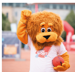
1 mascotte lion aka Titou !