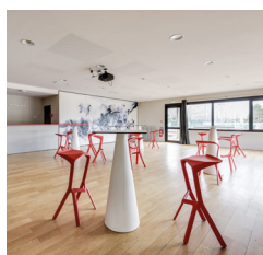
1 salle d'événements